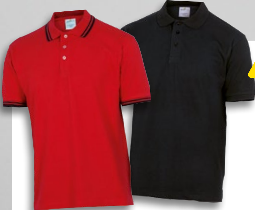
AGRARO Tailles : S, M, L, XL, XXL